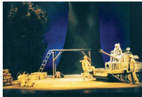
La granada, de Rodolfo Walsh. Dir.: Carlos Alvarenga. 2003. Archivo histórico TC - TNA.

TEATRO CERVANTES TEATRO NACIONAL ARGENTINO