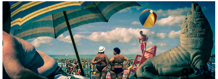
Balnearios, Mariano Llinás (Argentina, 2001)

TEATRO CERVANTES TEATRO NACIONAL ARGENTINO