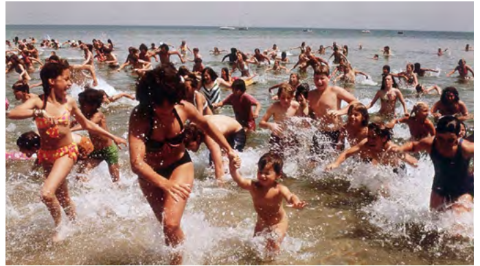
Tiburón, Steven Spielberg (EEUU, 1975)