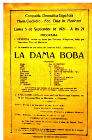
María Guerrero en La dama boba de Lope de Vega y el programa inaugural de la misma obra, 1921