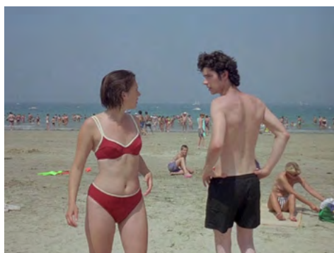
Cuento de verano , Eric Rohmer (Francia, 1996)