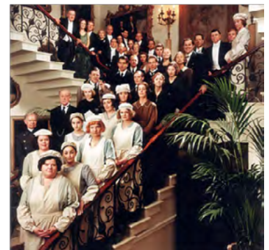
Gosford Park. (Robert Altman, 2001) Trailer: https://www.youtube.com/watch?v=CjXdmXhwiQk

TEATRO NACIONAL ARGENTINO TEATRO CERVANTES