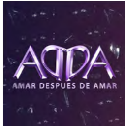
Amar después de Amar. (Serie emitida en 2017 por Telefé, Argentina)

El accidente de una pareja en la ruta desencadena una historia de amores y engaños contada en dos tiempos: los amantes secretos durante el pasado y el presente donde dos matrimonios se cruzan casualmente.