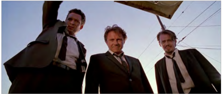
Perros de la calle. (Quentin Tarantino, 1992) Trailer: https://www.youtube.com/watch?v=oUlh59h1JCA

El accidente de una pareja en la ruta desencadena una historia de amores y engaños contada en dos tiempos: los amantes secretos durante el pasado y el presente donde dos matrimonios se cruzan casualmente.