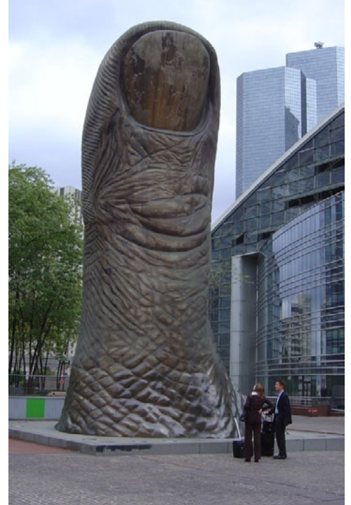
Pulgar, César, 1965