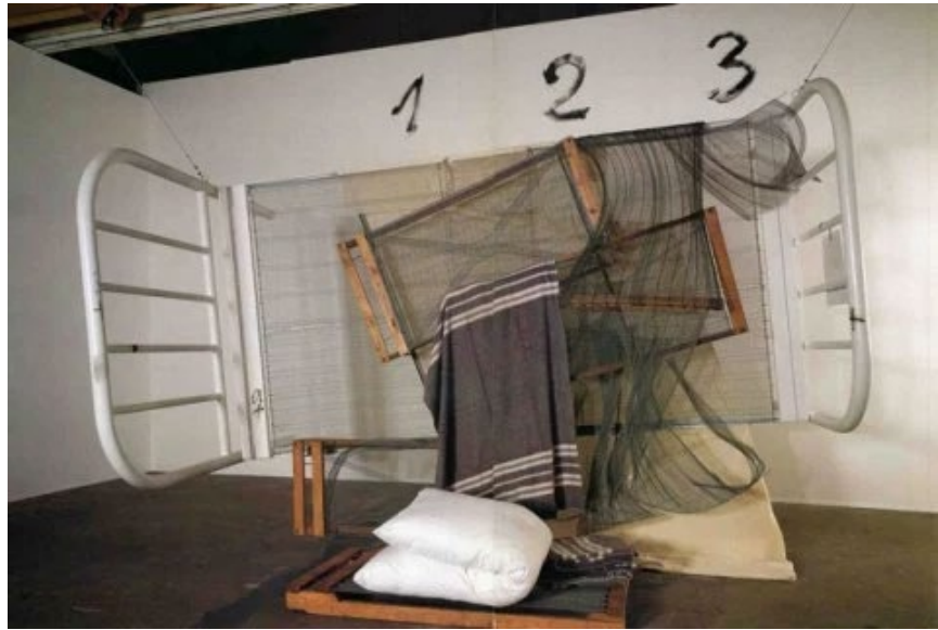
Rinzen, Tàpies, 1998