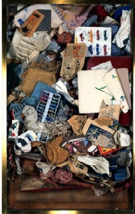
Basura de niños, Arman, 1960

2) Observen las imágenes a continuación y busquen otras esculturas de Tàpies, Arman y César (otros artistas del “nuevo realismo”, arte de vanguardia de los años '60):