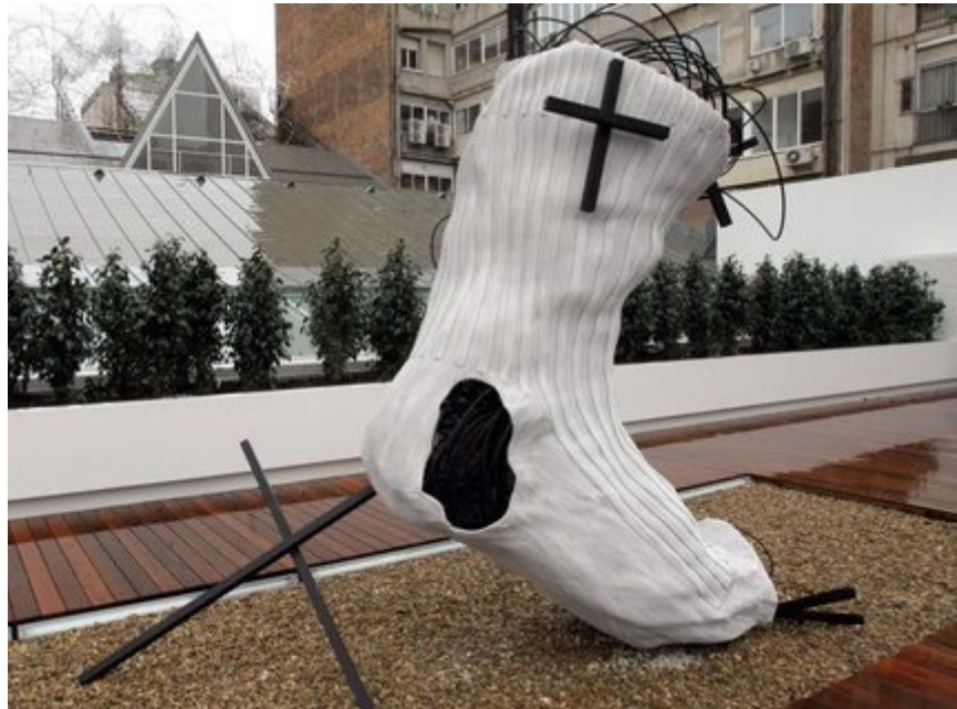
Calcetín, Tàpies, 1992-2010