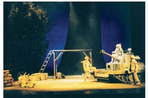
La granada, de Rodolfo Walsh. Dir.: Carlos Alvarenga. 2003.

TEATRO NACIONAL ARGENTINO TEATRO CERVANTES