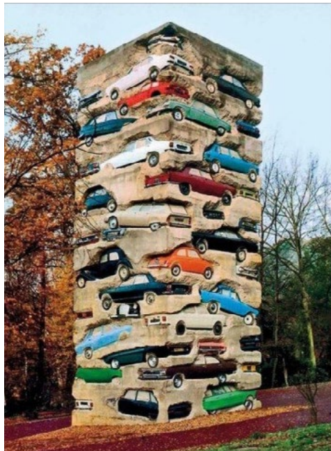
Estacionamiento de larga estadía, Arman, 1982

TEATRO NACIONAL ARGENTINO TEATRO CERVANTES