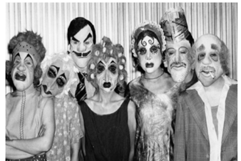
Calé. Buenos Aires en camiseta, de M. M. Hernández. Dir.: Francisco Javier. 1993.