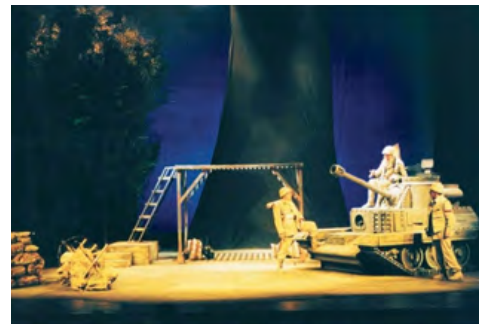
La granada, de Rodolfo Walsh. Dir.: Carlos Alvarenga. 2003.

TEATRO NACIONAL ARGENTINO TEATRO CERVANTES