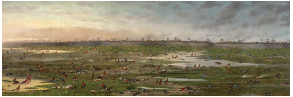
Después de la batalla de Curupaytí (Argentina, 1893) Pintura de Cándido López