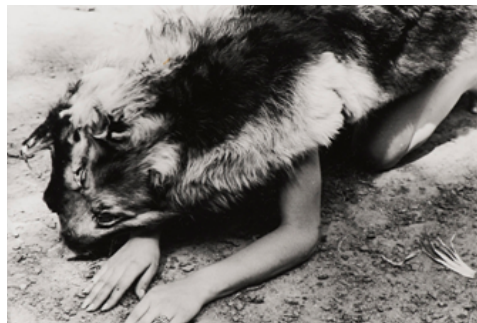
Perro (EEUU, 1974) Fotografía de Ana Mendieta