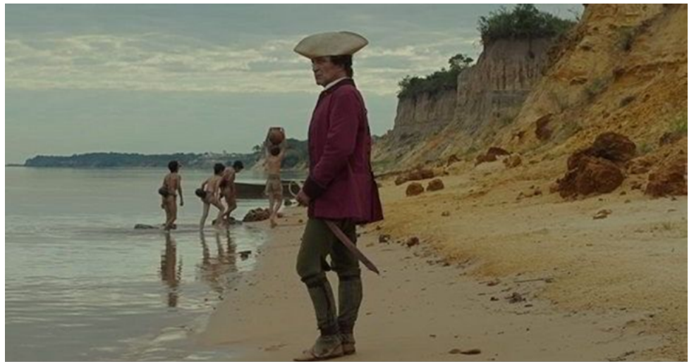
Zama (Argentina, 2017) Película de Lucrecia Martel