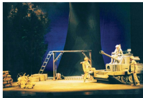
La granada, de Rodolfo Walsh. Dir.: Carlos Alvarenga. 2003. Archivo histórico TNA - TC.

TEATRO NACIONAL ARGENTINO TEATRO CERVANTES