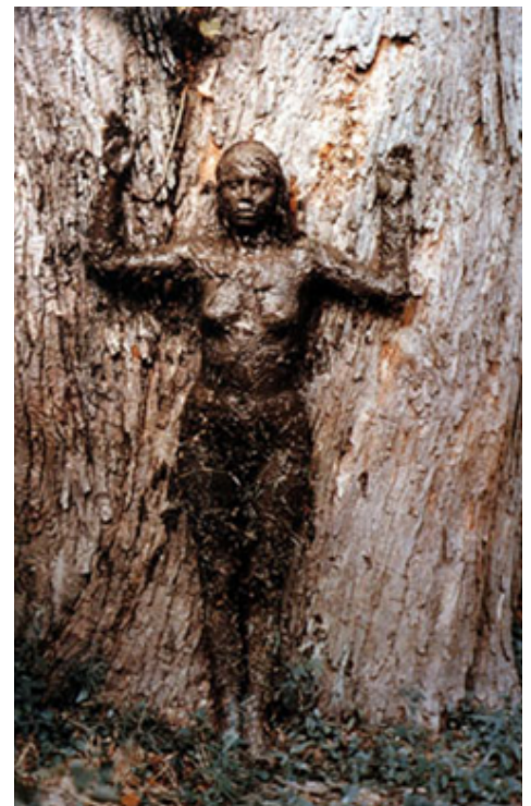
El árbol de la vida (EEUU, 1977) Fotografía de Ana Mendieta

TEATRO NACIONAL ARGENTINO TEATRO CERVANTES