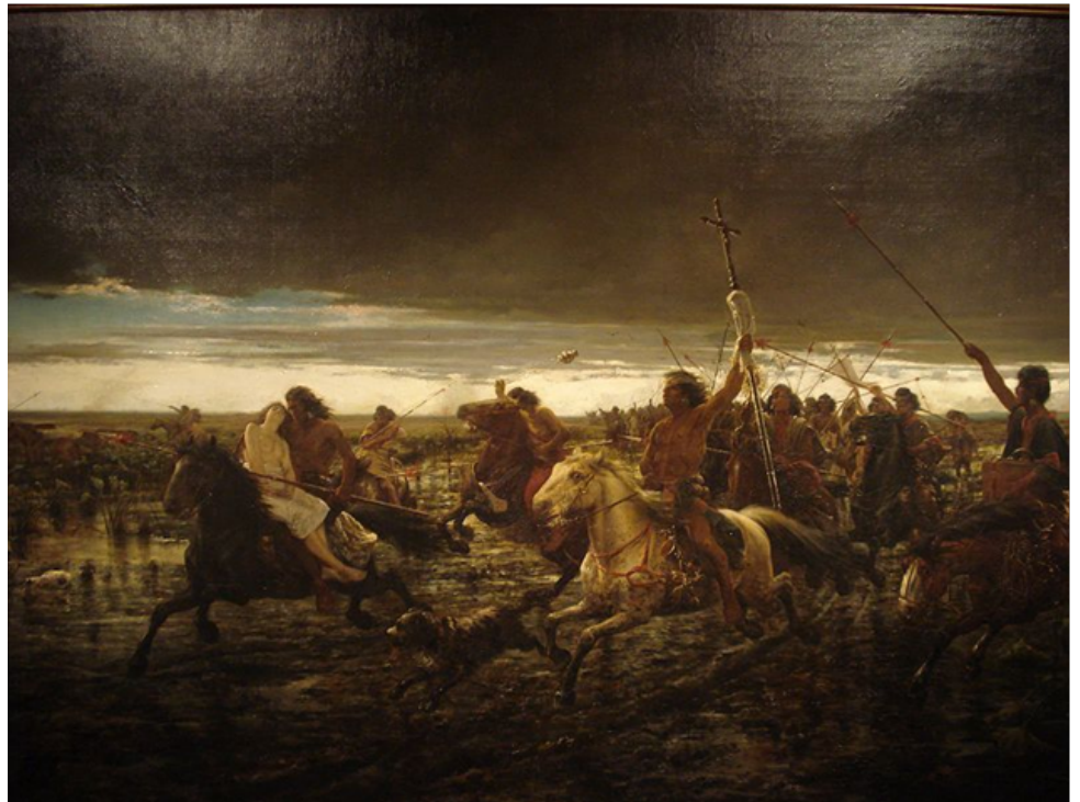
Della Valle, Ángel La vuelta del Malón (1892)