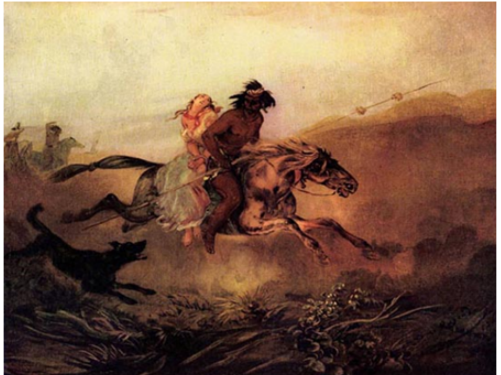
El Rapto de la cautiva (Argentina, 1845) Pintura de Juan Mauricio Rugendas