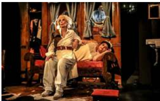
No me pienso morir de Mariana Chaud. Dir: Mariana Chaud. 2017. Sala Orestes Caviglia.