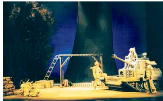
La granada , de Rodolfo Walsh. Dir.: Carlos Alvarenga. 2003.