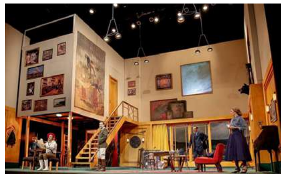
La Terquedad de Rafael Spregelburd. Dir: Rafael Spregelburd. 2017. Sala María Guerrero.