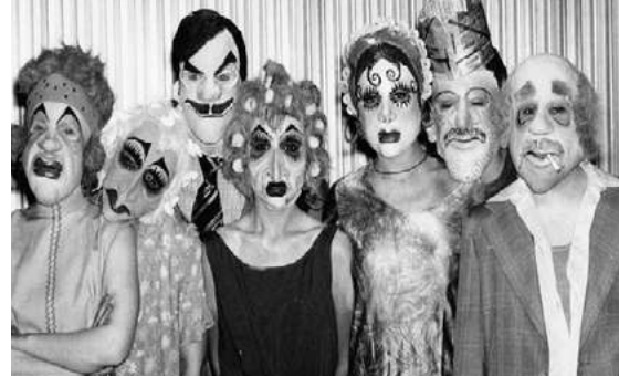
Calé. Buenos Aires en camiseta , de M. M. Hernández. Dir.: Francisco Javier. 1993.