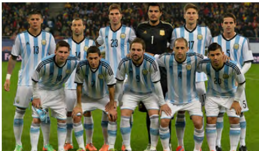
Selección argentina de fútbol. 2016. Copa América y Juegos Olímpicos.