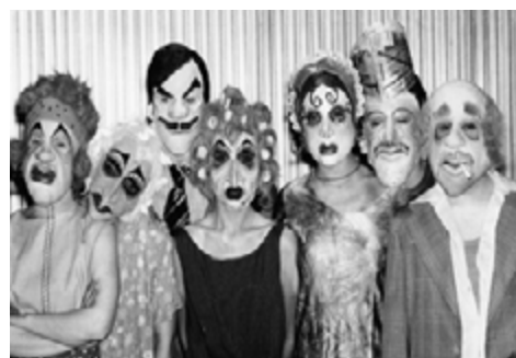
Calé. Buenos Aires en camiseta, de M. M. Hernández. Dir.: Francisco Javier. 1993.