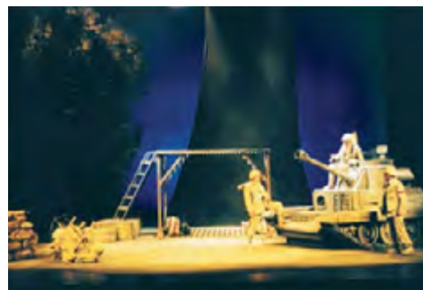
La granada, de Rodolfo Walsh. Dir.: Carlos Alvarenga. 2003. Archivo histórico TC - TNA.

TEATRO CERVANTES TEATRO NACIONAL ARGENTINO