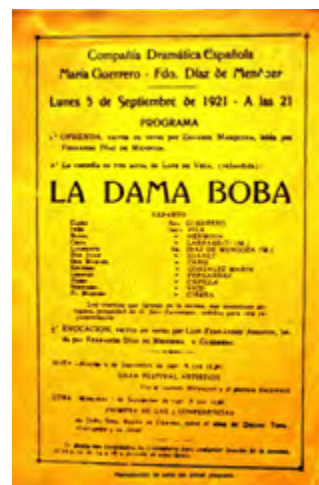
María Guerrero en La dama boba de Lope de Vega y el programa inaugural de la misma obra, 1921

TEATRO CERVANTES TEATRO NACIONAL ARGENTINO