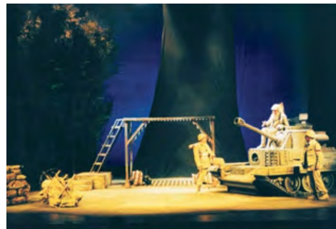
La granada , de Rodolfo Walsh. Dir.: Carlos Alvarenga. 2003.

TEATRO CERVANTES TEATRO NACIONAL ARGENTINO