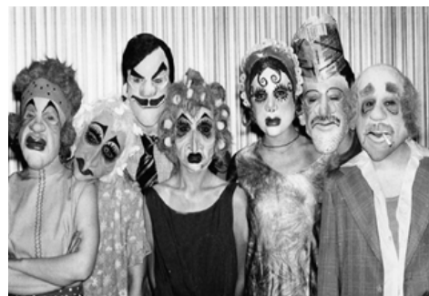
Calé. Buenos Aires en camiseta , de M. M. Hernández. Dir.: Francisco Javier. 1993. Archivo histórico