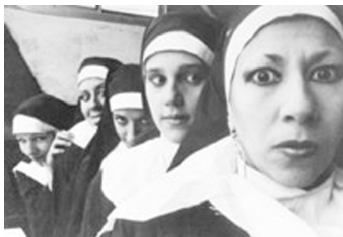
Imágenes de las Gambas al Ajillo.

TEATRO CERVANTES TEATRO NACIONAL ARGENTINO