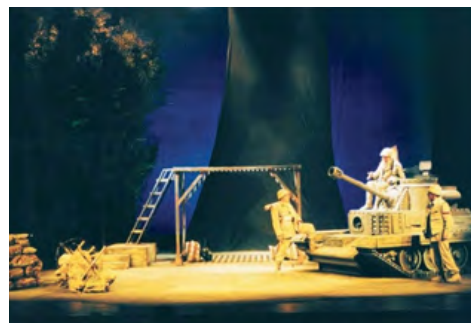
La granada, de Rodolfo Walsh. Dir.: Carlos Alvarenga. 2003.

TEATRO NACIONAL ARGENTINO TEATRO CERVANTES