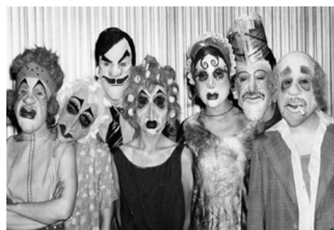
Calé. Buenos Aires en camiseta, de M. M. Hernández. Dir.: Francisco Javier. 1993. Archivo histórico TNA - TC.