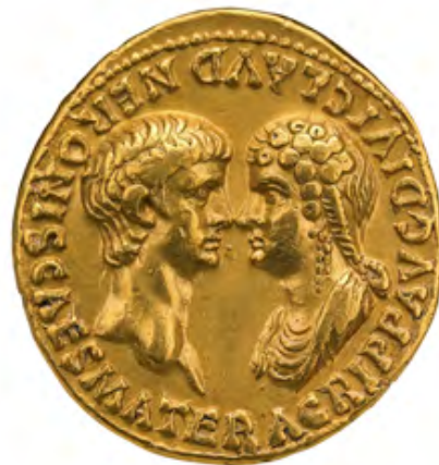
Nerón y Agripina. Anverso de un áureo (moneda). 54 d.C. Museo Británico, Londres

El género que el dramaturgo de Enobarbo inventa para su texto dramático es el de la “intriga político-teatral”. Nerón, emperador déspota de la Roma del primer siglo D.C. y los personajes de la obra son personajes del ámbito del poder político, pero también del campo artístico, como el filósofo y escritor trágico Séneca, autor de Tiestes o Petronio, autor del Satiricón . El mismo Nerón es presentado en su vocación de actor y músico, con más ganas de actuar y cantar que de gobernar. De hecho, la obra puede leerse también como una farsa sobre las diferentes posturas acerca del teatro, aunque esta sea una lectura posterior y un anacronismo, también fundante del humor de la obra. Séneca y Petronio aparecen como los defensores de un teatro de texto, de formas clásicas y refinadas, y Nerón, con su canto desafinado y sus intentos musicales fallidos, como el buscador de un teatro “total”: con música, baile, un espectáculo popular, de masas, que encante a un público fascinado.