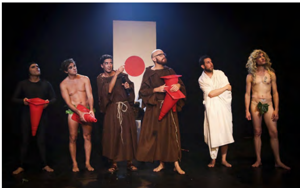
Senza parole (2017)

Aquí pueden ver un fragmento de Puro Bla Bla! (2013):