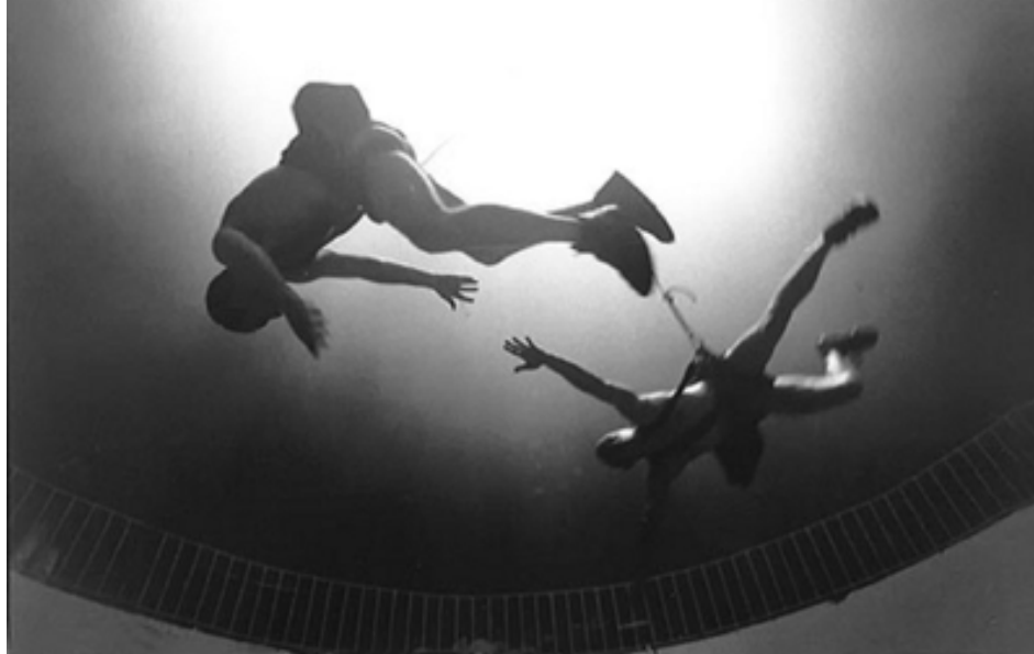
Tirolesa. Espectáculo de la Organización Negra. Año 1988