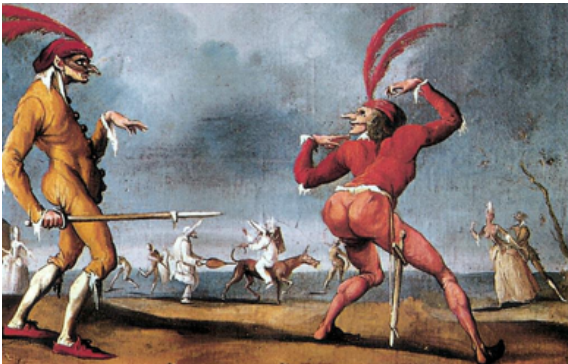
Personajes de la Commedia dell'Arte

“La palabra es una urgencia del cuerpo” decía el pedagogo y director francés Jacques Lecoq. Con sus múltiples investigaciones en el campo de la técnica actoral, que comienzan en Francia luego de la Segunda Guerra Mundial y llegan hasta nuestros días a través de sus muchos discípulos, fue uno de los grandes renovadores de la técnica del actor, rescatando