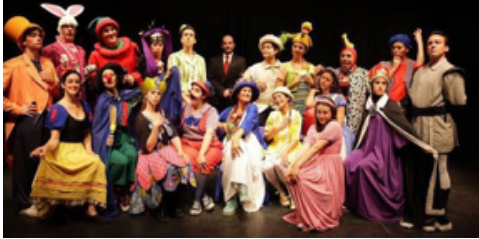
Teatro para niños y niñas