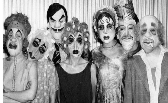
Calé. Buenos Aires en camiseta , de M. M. Hernández. Dir.: Francisco Javier. 1993.