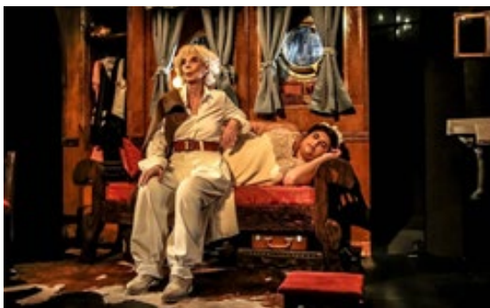
No me pienso morir de Mariana Chaud. Dir: Mariana Chaud. 2017. Sala Orestes Caviglia.