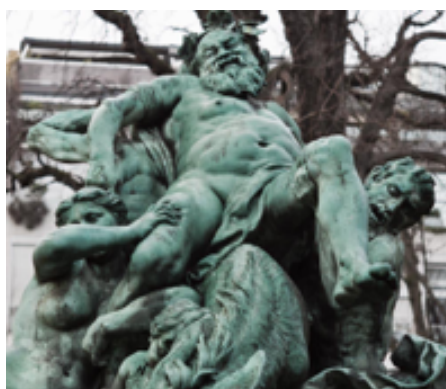
El triunfo de Sileno. Aimé Jules Dalou, hacia 1884, Jardines de Luxemburgo, Francia.

Ahora observá otras representaciones posteriores de Sileno, un personaje asociado a los sátiros: