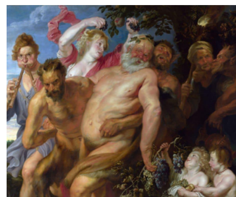
Sileno ebrio cargado por sátiros, Van Dyck, hacia 1620. National Gallery Londres (Inglaterra)