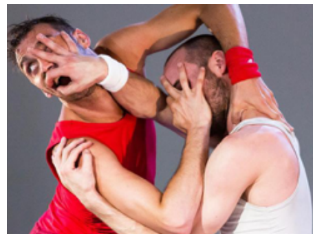
Un Poyo Rojo. Espectáculo de danza y teatro físico. Año 2009 hasta la actualidad.