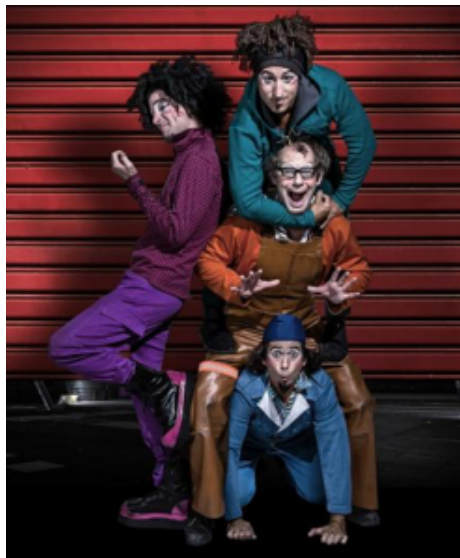
La Pipetuá. Compañía de Clown contemporánea.