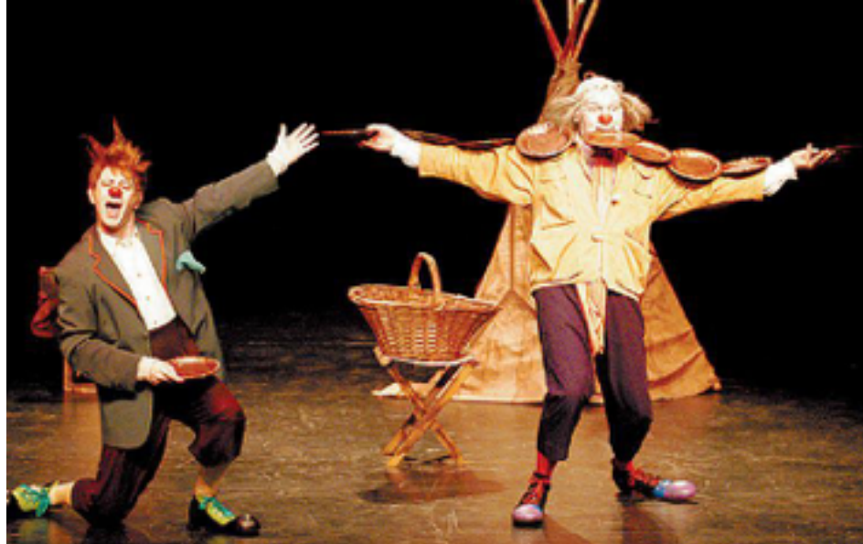
Circo tradicional / payasos