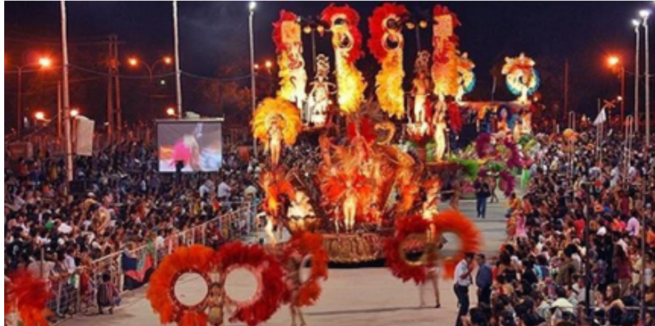
Curso de carnaval en la provincia de Corrientes.

4. Elegí una de las siguientes imágenes.