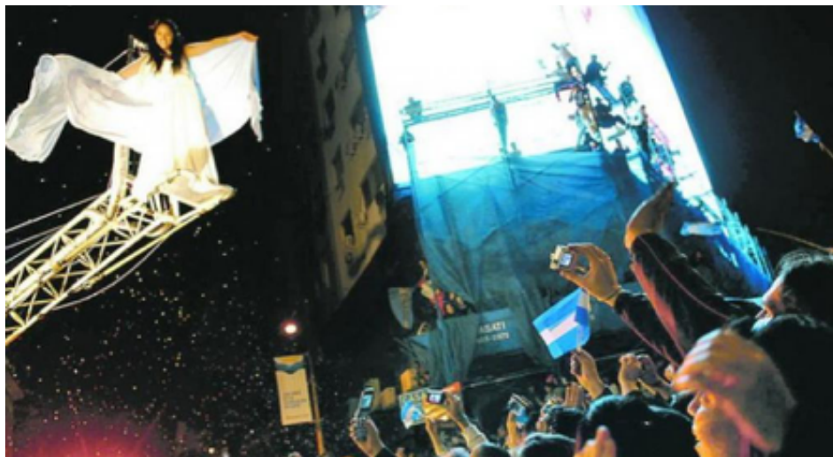
Espectáculo de la Cía. Fuerza bruta en festejos por el bicentenario argentino.

Identificá a qué se le “rinde culto” en cada una de ellas y los elementos que componen cada celebración. ¿En lugar de tirar ambos, cuáles serían los cantos y coros en un festejo patriótico? ¿Y en vez del tiasos griego, el cortejo descontrolado que alienta a una comparsa en un curso de carnaval? Mezclando las referencias y elementos, imaginá nuevas celebraciones posibles, entre la fiesta, el festejo nacional y la creencia.