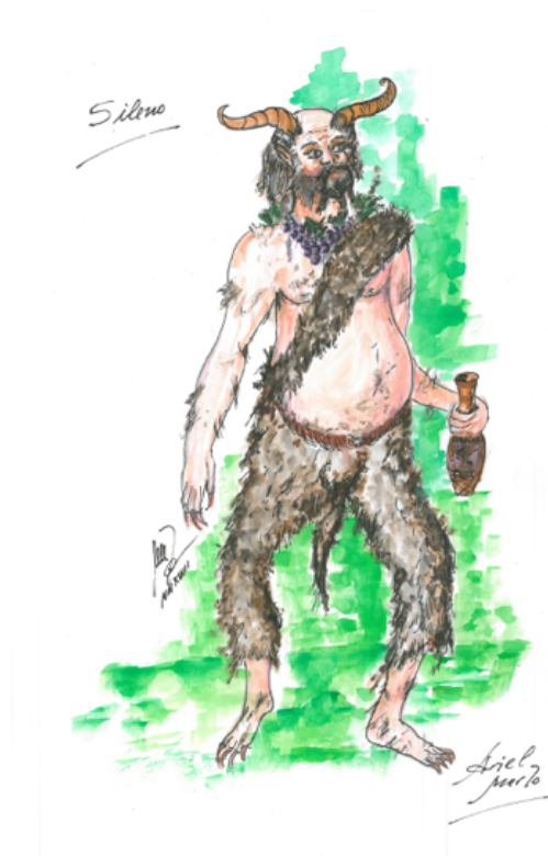
Figurines de vestuario Silenos para Los desentrañadores de enigmas . Ariel Merlo

2 - Buscá información sobre los mitos de Dionysos y sobre Silenos, nombre dado en general a los sátiros viejos y también al personaje que habría educado a Dionysos.