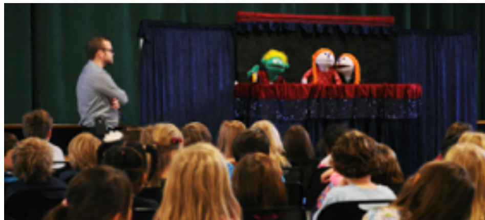
Teatro de títeres