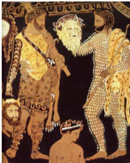
Detalle del jarrón de Pronomos, conservado en el Museo Arqueológico de Nápoles.

partes de su cuerpo al descubierto. En la segunda imagen se representa un tiaso dionisiaco, el cortejo del culto a este dios: