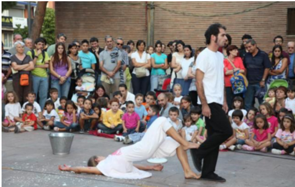
Teatro de calle