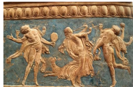
Placa de terracota. Siglos I a.c./I d.c.

Ahora observá otras representaciones posteriores de Sileno, un personaje asociado a los sátiros: