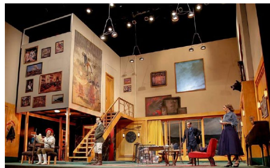
La Terquedad de Rafael Spregelburd. Dir: Rafael Spregelburd. 2017. Sala María Guerrero.