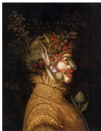
Verano, Giuseppe Archimboldo

2. ¿Qué tal si representan a Cyrano de Bergerac al estilo del artista Archimboldo (famoso artista que representaba rostros humanos con flores, frutas u otros objetos)? ¿O como el ilustrador argentino Pablo Bernasconi: usando objetos? ¿Qué cosas colocarían y en dónde? ¿Un pepino por nariz? ¿Qué habrá en sus ojos? (Pueden hacer este ejercicio de representación con todos los personajes de la obra).