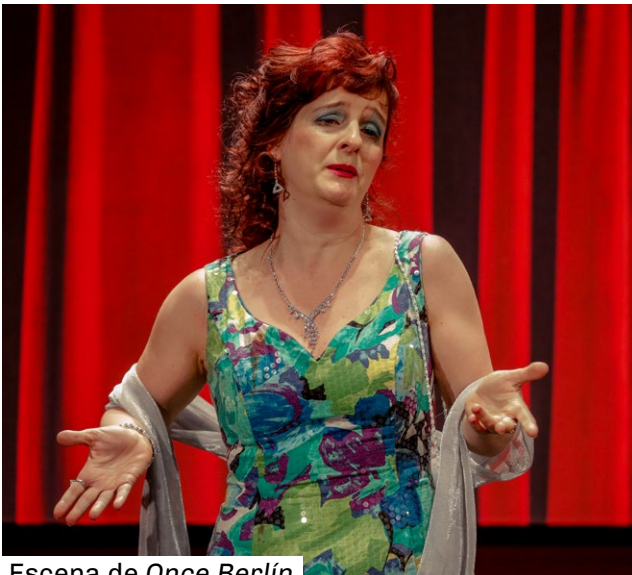
Escena de Once Berlín