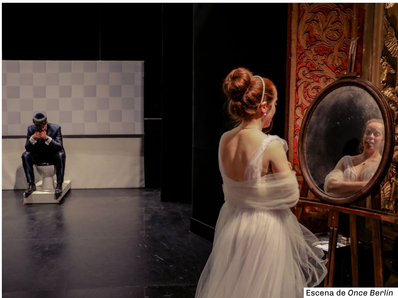
Escena de Once Berlín