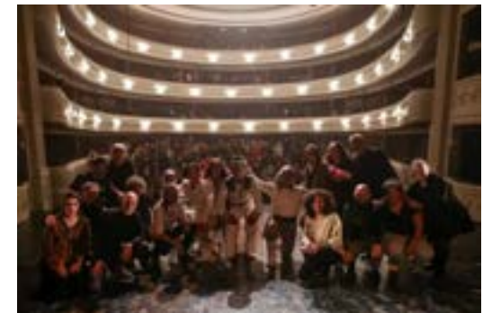
"Los establos de Su Majestad", una obra de teatro para ver y reflexionar.

Este fin de semana se estrenó en el Teatro Independencia la obra "Los establos de Su Majestad", cosechando aplausos y abriendo un panorama muy bueno.